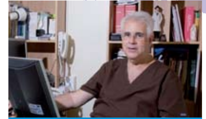
Fundador de la Unidad

El 26 de enero de 1993 hicimos la primera consulta en la "Unidad de Mastología y Atención de la Menopausia", para ese tiempo instalado en el C.C. Vistamar. Desde ese momento "La Unidad" ha ido ocupando un lugar cada vez mas significativo en la atención médica de la mujer oriental. La incorporación progresiva de especialistas altamente capacitados; la introducción en la zona y en Venezuela de nuevas tecnologías como la Densitometría Ósea, las Biopsias Ecoguiadas y Estereotáxicas de la mama, la Mamografía Digital, la biopsia del Ganglio Centinela; las historias clínicas computarizadas, la posibilidad de manejo estadístico confiable y la discusión multidisciplinaria permanente de casos clínicos, así como una intensa labor de educación médica continua e información de la población general, han empedrado la senda transitada.