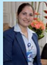
Editora: Pilismar Solórzano

Es una publicación trimestral de: Diagnósticos C.A. Rif. J-30080530-1